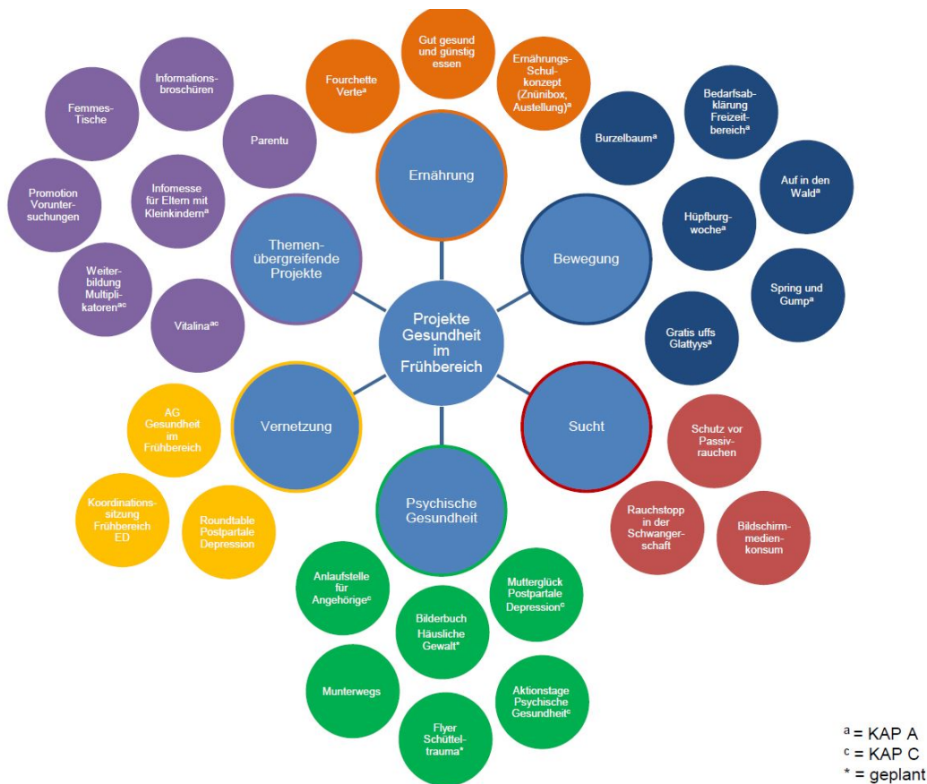
Abb. 1: Durch das Gesundheitsdepartement unterstützte Aktivitäten im Frühbereich